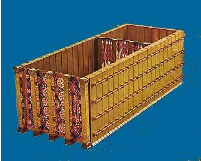
Vue de la porte d'entrée et du voile